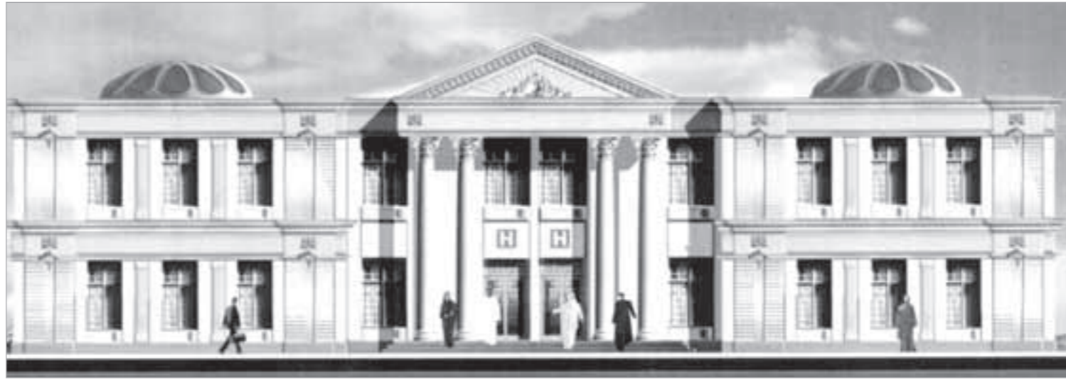
تموزج لمستشفى مدينة صباح الاحمد السكنية

وعددها 3 مشاريع سكنية جديدة تحت الدراسة ستوفر 63 الف وحدة سكنية منها مدينة صباح الاحمد ومدينة الخيران في الجنوب والتي تشمل على 35844 وحدة سكنية الى جانب المطلاع في الشمال وتشمل 18 الف وحدة سكنية منها 12600 قسيمة و5400 بيت حكومي. وفي نهاية الاجتماع وعد أعضاء اللجنة الوزارية بمتابعة جميع الملاحظات التي ايدتها ودونتها في اجتماعها معهم مع التزامهم بتوزيع مدينة صباح الاحمد مطلع العام المقبل كإحدى مشاريع التنمية.