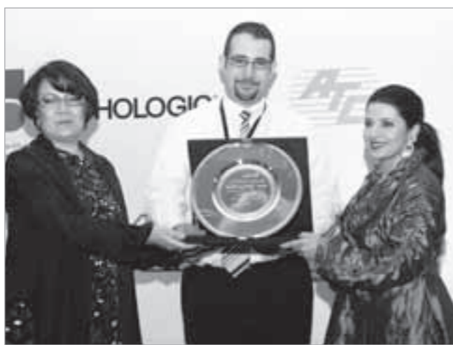
دور لمثلة شركة السينما الكويتية

من قبل فريق طبي من الكويت بالتعاون مع فريق طبي بريطاني من مستشفى كنج كولج وسيتم لأول مرة في تاريخ أقسام الأشعة إرسال بعض الحالات لمستشفى كنج كولج عن طريق الشبكة الإلكترونية في قسمي الأشعة الكويتي والبريطاني وذلك لتفعيل التعاون المستقبلي في تشخيص الحالات ومجالات التطور التكنولوجي الذي حرصت عليه دوما أقسام الأشعة في الكويت. فسي نهاية الحفل قدمت السدرو لجهات الرعاية كشكر لكل من ساهم في إنجاح هذا البرنامج من شركات ومؤسسات.