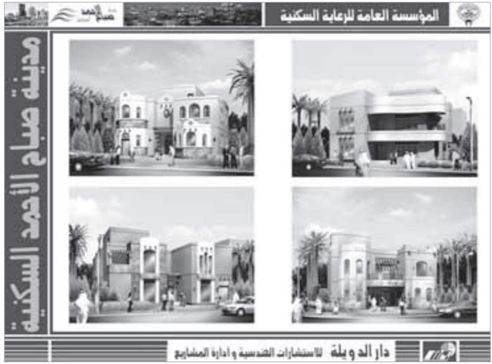
نماذج لبيوت في المدينة

كما تقدم الدار الاربعة المقبل وضمن موسمها الثقافي ايضا في نفس الموقع وفي تمام الساعة مساء محاضرة بالانجليزية تقدمها البروفيسورة اليابانية ميشيكو هوري تحت عنوان «الثياب التقليدية في اليابان».